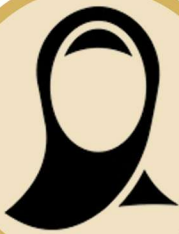
أ-موزة سلطان النعيمي (أمين سر)