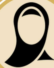
أ-مشعاء الكواري (عضو)